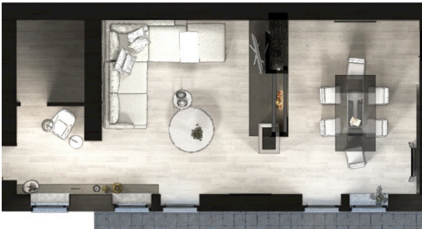
Planimetria zona giorno